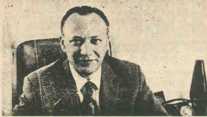
Ο Γλ. Κληρίδης στη τελευταία -του ανοικτή επιστολή ε- χτος από μαθήματα δημοκρατίας δίνει και μαθήματα κοινωνι- κής κριτικής. Ώσπου μπορεί να προχωρήσει;

Είναι ολοκάθαρο ότι ο ΔΗΣΥ προσπαθεί να οικειοποιηθεί με διάφορες φιλολαϊκές κριτικές τα μικροαστικά και πλατιά λαϊκά στρώματα. Μετα την αποτυχία της οικονομικής πολιτικής του ΔΗΚΟ και την δυσφορία των λαϊκών στρωμάτων ο ΔΗΣΥ κάνει μια προσπάθεια να προσεταιριστεί αυτά τα στρώματα. Έτσι προβαίνει σε κοινωνικές κριτικές και μιλά για σπατάλες. Προσοχή όμως να μη θιχτεί το κεφάλαιο, η οικονομική πίεση στο λαό είναι αποτέλεσμα κυβερνητικών δαπανών κι όχι ΣΑΠΙΣΜΑ ΚΑΙ ΚΡΙΣΗ ΟΛΟΥ ΤΟΥ ΟΙΚΟΝΟΜΙΚΟΥ ΚΑΙ ΚΟΙΝΩΝΙΚΟΥ ΟΙΚΟΔΟΜΗΜΑΤΟΣ. Αυτό προσπαθεί να πείσει ο ΔΗΣΥ το λαό για να τον εγκλωβωθεί.