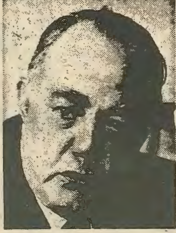
δο της εργατικής τάξης των μαύρων.

Απο την άλλη η μεγάλη βιομηχανική και τεχνολογική ανάπτυξη αύξησε την αριθμητική δύναμη και το μορφωτικό επίπε-